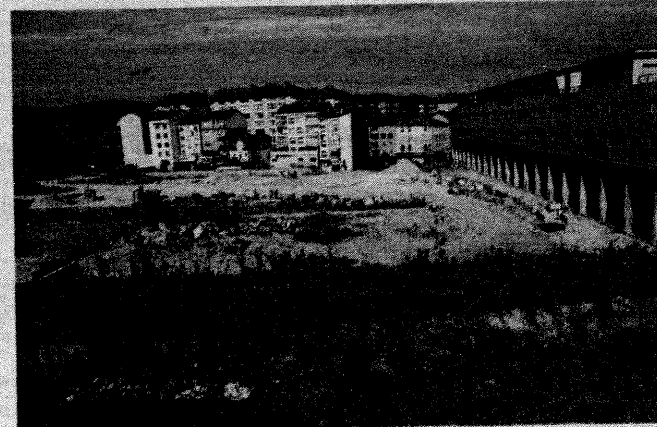
El solar con la residencia estudiantil a la derecha.

En julio, el TSXG aumentó la indemnización hasta los 202.000 euros y, pese a que ambas partes recurrirán ante el Supremo, la defensa de la empresa pidió la ejecución provisional para poder recibir ya el dinero. Ahora, el tribunal les reconoce este derecho sin necesidad de depositar fianza -por si se revocase- al considerar la "reconocida solvencia" de la empresa. ■